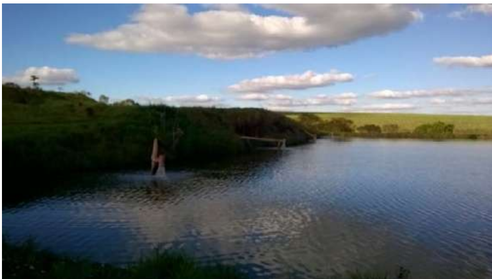
Figura 6. Vista global da segunda lagoa facultativa. Ao fundo observam-se as estruturas de coleta de efluente.