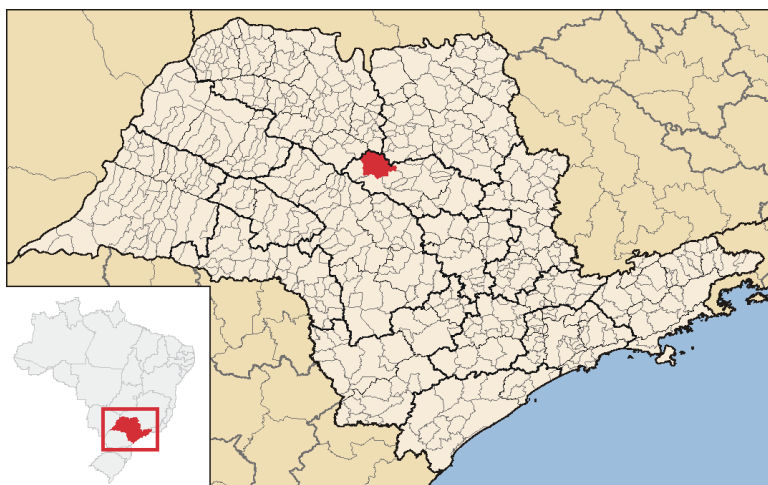
Figura 1. Localização do município de Itápolis no Estado de São Paulo