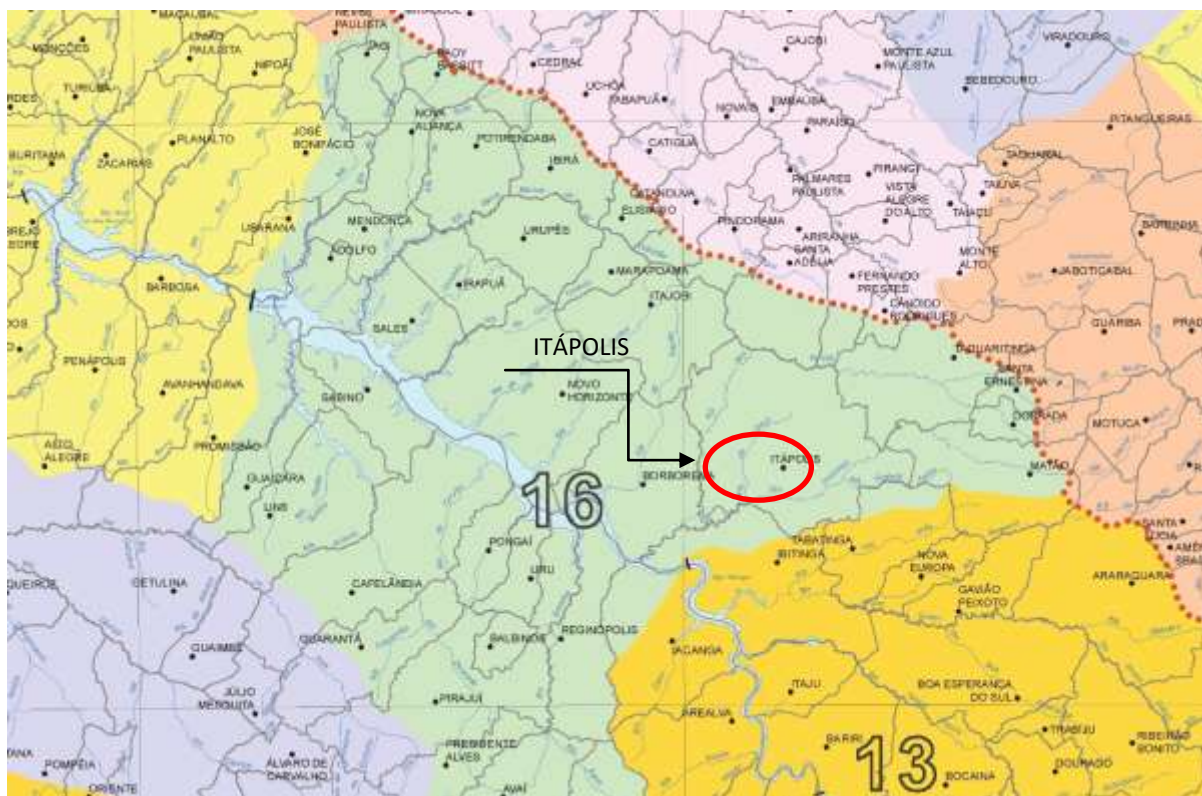
Figura 2. Localização do Município do Mapa de Bacias Hidrográficas do Estado