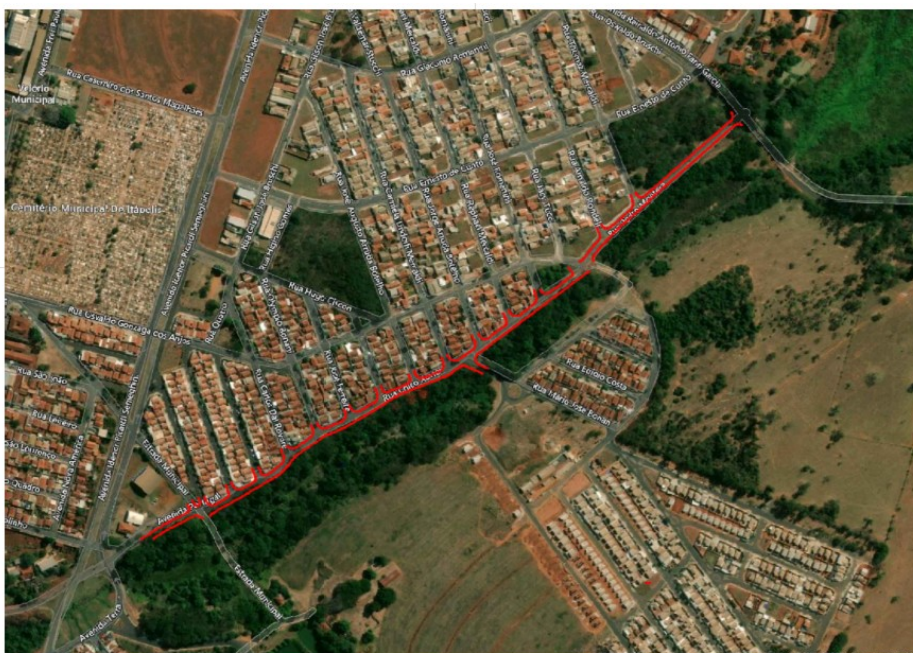
Figura 01: Localização onde será construído emissário do Bairro Dona Bella no município de Itápolis (SP).

Fica estabelecido que os tubos de PVC Ø 300 mm, os anéis e cones de concreto dos PVs e as tampas de ferro fundido Ø 600 mm serão fornecidos pelo SAAEI, cabendo à contratada o transporte interno, armazenamento, manuseio e correta instalação desses componentes, conforme as normas técnicas da ABNT e as orientações da fiscalização.