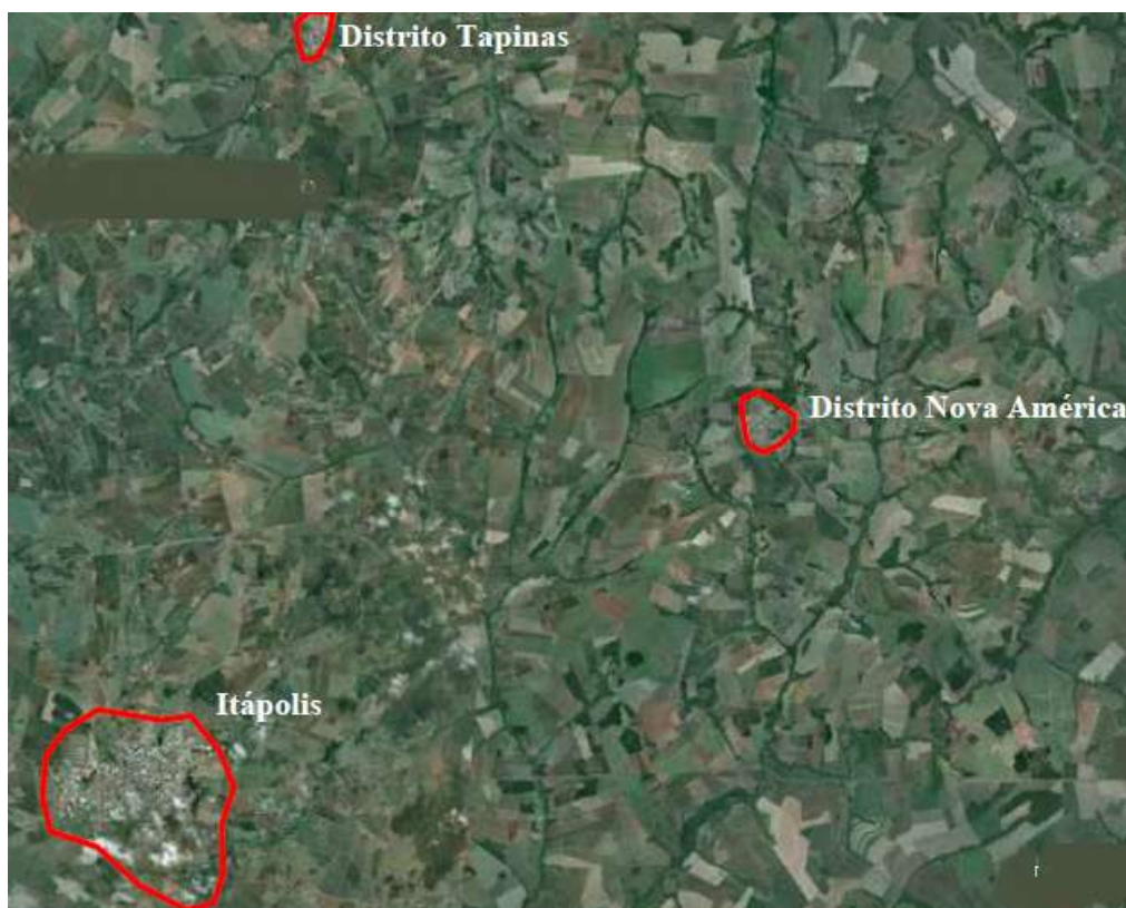
Figura 6. Vista da localização do Município e Distritos.

No Distrito de Nova América o esgoto bruto é captado e transportado por gravidade para a Estação de tratamento de esgoto do Distrito. O efluente é submetido ao tratamento preliminar, composto por unidade de gradeamento, caixa de areia e calha parshall. Após este tratamento é realizado o recalque do esgoto através de uma elevatória para a Estação de Tratamento de Esgoto (ETE), composto por um Reator Anaeróbio, um Reator Aerado, um Decantador e um Tanque de Desintecção, todos os tanques são confeccionados de Fibra de Vidro.