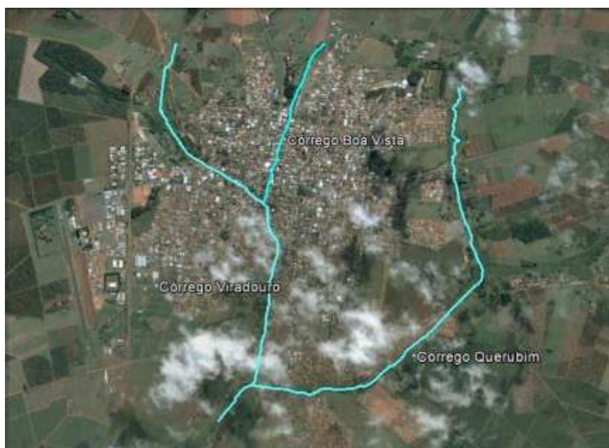
Figura 3. Córregos que cortam a cidade: Boa Vista, Viradouro e Querubim.

O município está na sub-bacia 81- Rio São Lourenço, sendo cortado pelos córregos Boa Vista, Viradouro e Querubim, conforme apresentado na Figura 3.