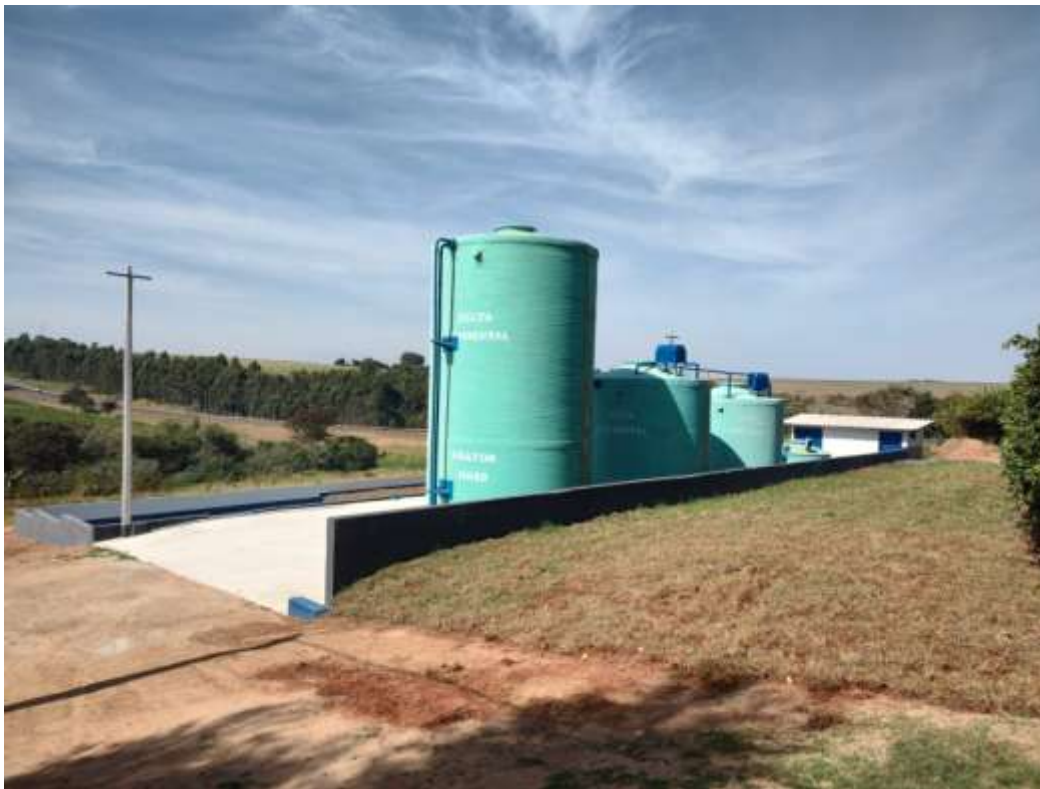
Figura 6. Vista da ETE do Distrito de Nova América.