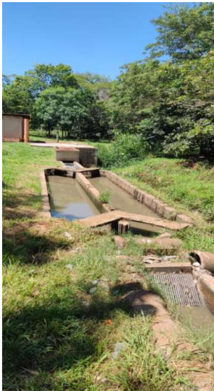
Figura 5. Vista do tratamento preliminar EEE.

Existem no município de Itápolis dois distritos, sendo estes, Nova América que fica a 19 km do Município e Tapinas que fica a 18 km do Município, apresentado a localização da sede e dos distritos pertencentes ao município de Itápolis.