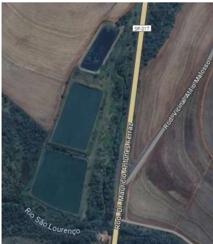
Figura 4. Vista da região das lagoas de tratamento.

Os esgotos brutos são captados e transportados por gravidade para a Estação Elevatória de Esgoto (EEE) onde o efluente é submetido ao tratamento preliminar, composto por unidades de gradeamento, caixa de areia e calha parshall. Após este tratamento é realizado o recalque do esgoto através de uma elevatória para a Estação de Tratamento de Esgoto (ETE).