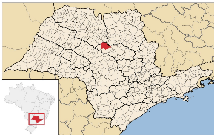
Figura 1. Localização do município de Itápolis no Estado de São Paulo

1.7. O município de Itápolis tem sua sede localizada dentro da Bacia Hidrográfica do Tietê-Batalha (CBH-TB).